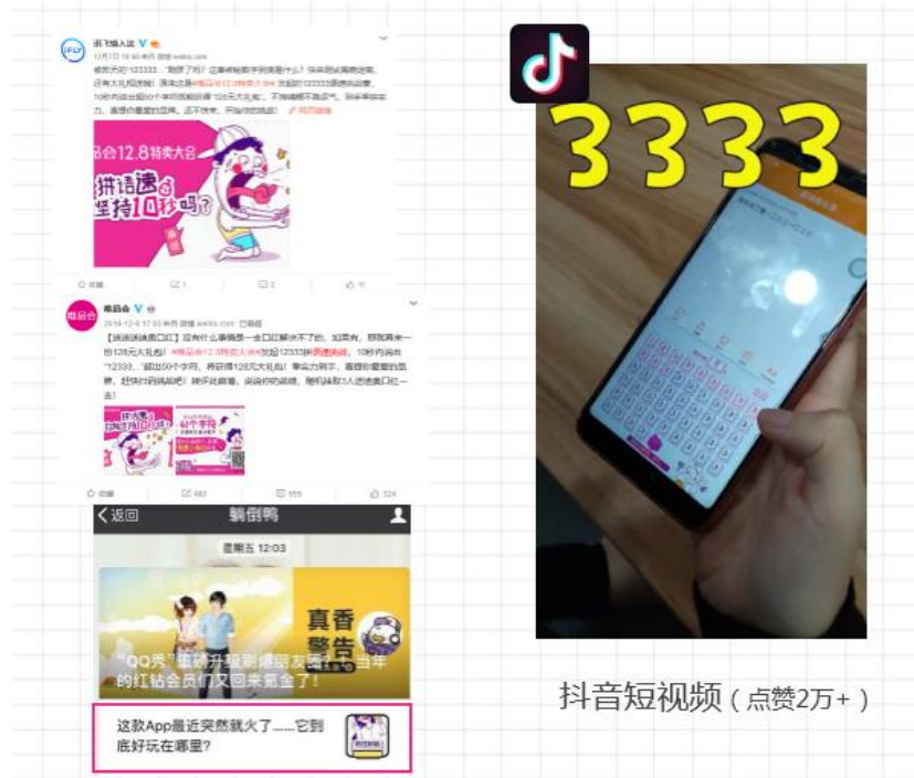
抖音短视频 (点赞2万+)

活动上线期，通过抖音、微博、微信 KOL、垂直营销号等多渠道进行输入法原生功能体验及语音 H5 引流。