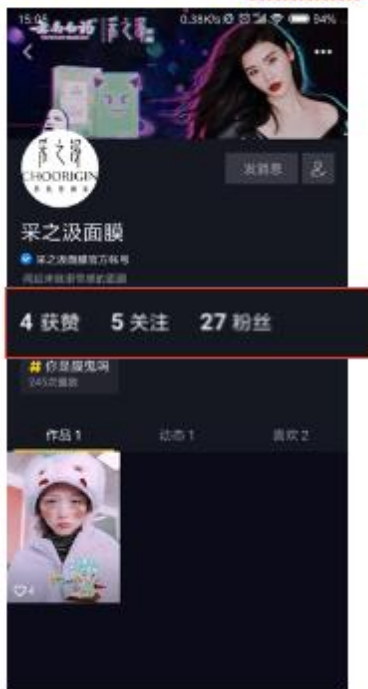
采之汲面膜主页-投放前