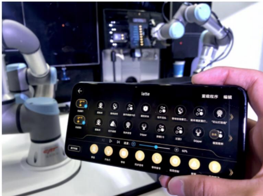
Magic 2 现场操控豹咖啡

可以说,豹咖啡真正让咖啡不再局限于咖啡馆,让用户随时随地消费一杯咖啡成为可能,办公室、医院、学校、商场、健身房等等,豹咖啡重构咖啡消费场所和场景,建立新的流量入口;在人口红利衰减、劳动力不足的社会背景下,豹咖啡充分解放咖啡大师,向精品咖啡大师发展,加速国内咖啡行业的升级;最后,豹咖啡重构消费者与咖啡机、咖啡店之间的交互关系,创造全新的互动方式,满足用户的即时消费。