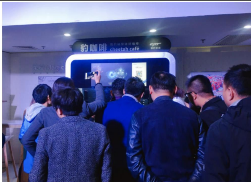
现场用户围观豹咖啡

作为中国互联网公司出海的领军者,猎豹移动先后在PC、移动互联网时代、人工智能时代,持续实现了行业的创新性跨越。AI+时代,猎豹移动又将技术与产品结合,软件和硬件结合,打造“真有用”机器人,为用户带来“真价值”。