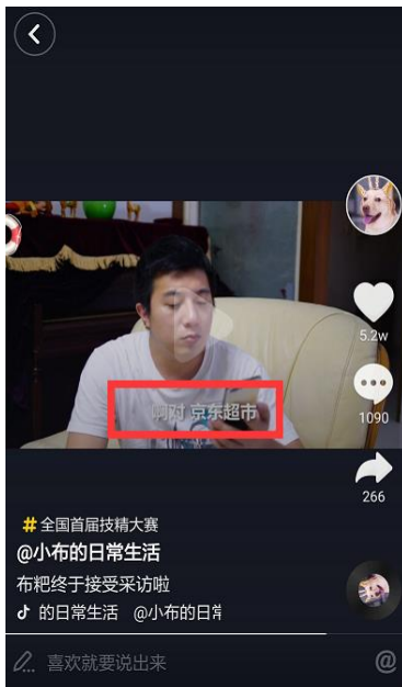
(抖音 KOL 小布的日常生活 参与抖音#全国首届技精大赛)

Kol 发布参与抖音#全国首届技精大赛 挑战视频, 17 家品牌跟进参与抖音话题互动, 并通过官方微博、微信等渠道进行集中引爆。