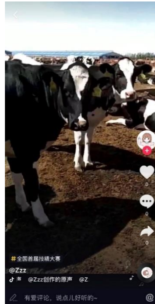
(圣牧参与抖音#全国首届技精大赛挑战)