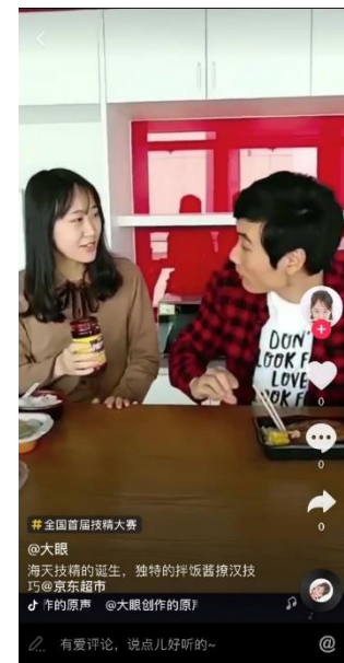
(海天参与抖音#全国首届技精大赛挑战)